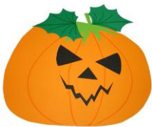
8. la _____