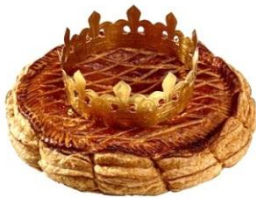
5. la galette des rois