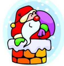
2. le père Noël