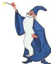
9. le magicien